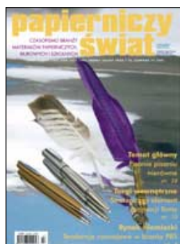
Okładka: fot. Robert Tyszek